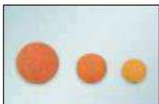
houbové míčky na čištění potrubí