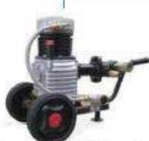
kompresor s hydraulickým motorem