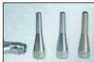
trysky pro vyplňování spojů