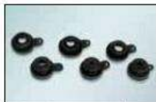
kaučukové trysky pro omítky