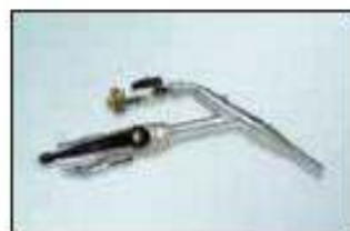
proudnice pro vyplňování spojů