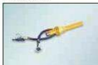
stříkací proudnice pro polyuretanový beton