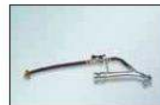
stříkací proudnice pro omítky