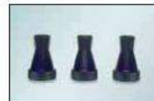
ocelové trysky pro omítky