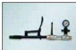
stříkací proudnice pro vstřikování s manometrem