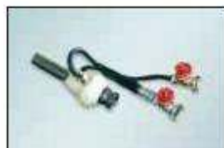
ocelová stříkací proudnice pro spritz beton